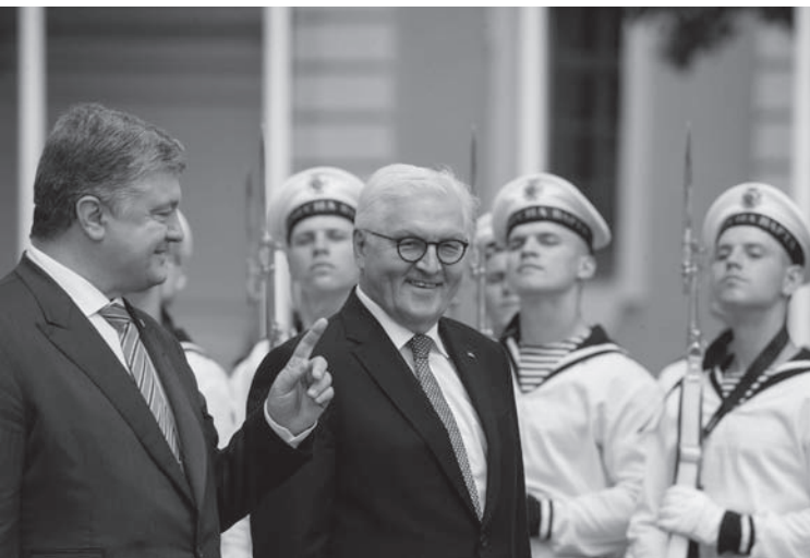
Bundespräsident Frank-Walter Steinmeier bei seinem Besuch in Kiew, 2018

Als »dümmste Regierung in Europa« bezeichnete Sahra Wagenknecht die deutsche Regierung in ihrer Bundestagsrede am 8. September. Aufgrund des Wirtschaftskrieges gegen Russland würden Millionen von Menschen mit nicht oder kaum noch bezahlbaren Energiekosten belastet, viele, vor allem kleine und mittelständische Unternehmen ständen vor dem Ruin.