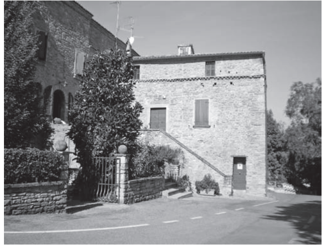
Mussolinis Geburtshaus in Predappio

Vor ziemlich genau hundert Jahren, im Oktober 1922, unternahm Mussolini den spektakulären »Marsch auf Rom«, in dessen Ergebnis der König ihn mit der Regierungsbildung beauftragte, d. h. die faschistische Diktatur über Italien begonnen wurde. Melonis Partei, die FdI, sieht sich in der Nachfolge der Partei Mussolinis, was sie in ihrer Symbolik (die Flamme in den italienischen Farben über dem Grab des Duce) erkennen lässt. In Italien gibt es zwar die Tradition der Resistenza, des Widerstandes gegen den Faschismus im eigenen Land und den der deutschen Besatzungsmacht, der der zahlenmäßig größte in Westeuropa war. Aber dennoch muss auf der anderen Seite festgestellt werden: Die Aufarbeitung des Faschismus läuft in Italien nicht nach demselben Muster wie in Deutschland, wo die Distanzierung vom Hitler-Regime, vom Genozid an der jüdischen Bevölkerung Europas (Holocaust), vom Rechtsextremismus (freilich auch gegen »Linksextremismus« gewandt) zur unhinterfragten bürgerlichen Staatsräson der BRD gehört. Manche Erscheinungen, wie etwa offiziell geduldete jährliche