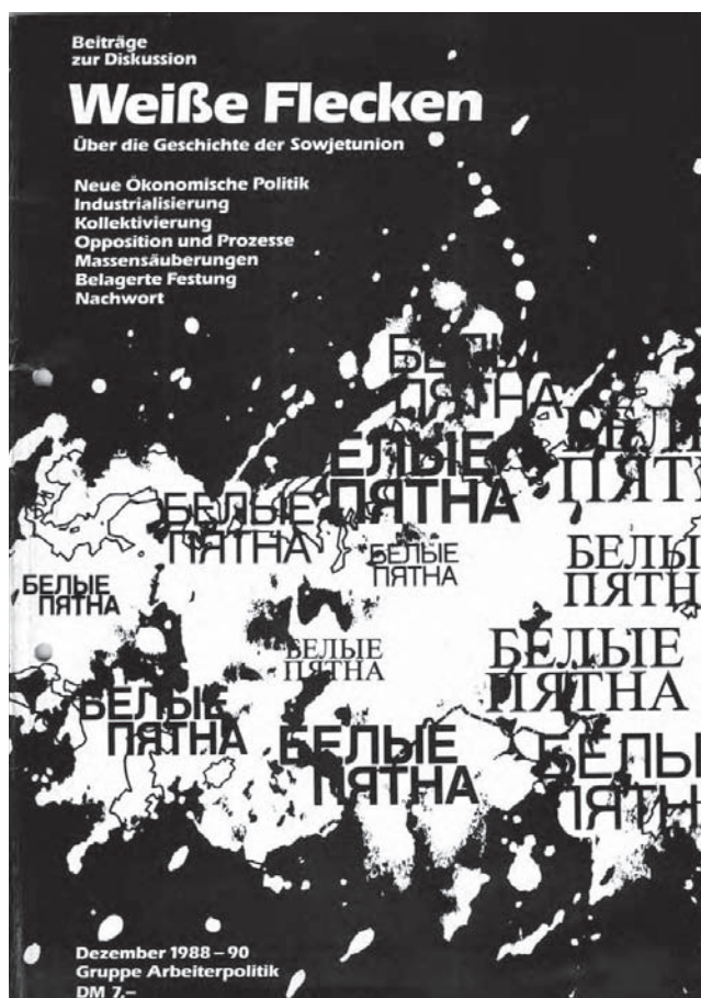
Dezember 1988/90 · Hrsg.: Gruppe Arbeiterpolitik 72 Seiten · 4,- Euro, zzgl. Versandkosten