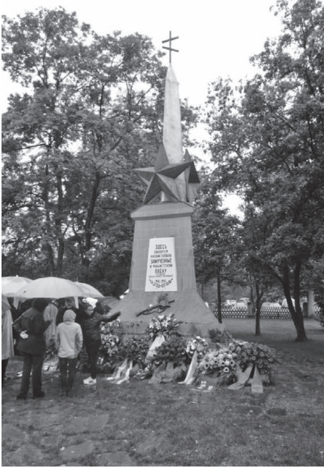
Mahnmal Stukenbrock 2019

Wir sollten weiterhin an die Mahnung von Christa Wolf erinnern: