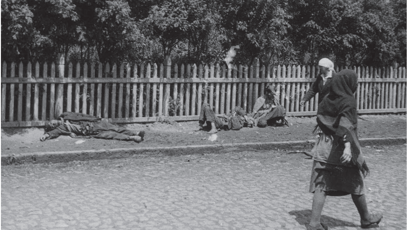
Verhungernde Bauern in Charkiw (1933)