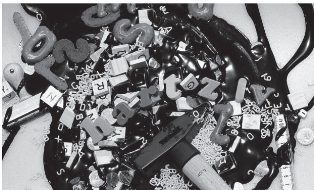
Kritische Darstellung von Hartz IV im ZDF Magazin Royale

Das neue Bürgergeld soll also kommen, wieder mal ein angebliches Jahrhundertwerk der Sozialpolitik. Die Ampelkoalition lobt sich überschwänglich für ihre Leistung, die Unionsparteien feiern sich dafür, dass sie aus einem schlechten Entwurf im Bundesrat noch ein gutes Gesetz gemacht hätten. Fragt man Betroffene oder liest/hört ihre Stellungnahmen in den öffentlichen Medien, so sind die allermeisten von ihnen enttäuscht oder bekundend Desinteresse, weil sich aus ihrer Sicht nichts ändern werde.