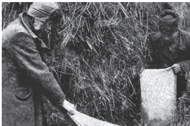
Getreidebeschlagung bei den Kulaken (1933)

Ampelkoalition und Unionsparteien haben am 30. November im Bundestag beschlossen, dass der sogenannte Holodomor 1932/33 in der Ukraine als Völkermord (Genozid) zu werten sei. Mit wissenschaftlich fundierter Aufklärung hat das nichts zu tun (nur fürs Protokoll sei vermerkt, dass Linke und AfD aus unterschiedlichen Gründen gegen diese Resolution stimmten). Der Beschluss vermerkt ausdrücklich: »Damit liegt aus heutiger Perspektive eine historisch-politische Einordnung als Völkermord nahe. Der Deutsche Bundestag teilt eine solche Einordnung.« Der Kniff dabei ist, dass eine juristische Anerkennung als Genozid letztlich doch vermieden werden soll. Erst 1948 hat nämlich die UNO den Begriff des Völkermordes definiert. Indem Deutschland sich darauf bezieht, dass der Holodomor erst im Nachhinein als Genozid gewertet wird, entzieht sich die Bundesregierung einer Bewertung eines anderen Verbrechens als Völkermord, die juristisch Entschädigungszahlungen nach sich ziehen würde: Gemeint ist die Niederschlagung der Aufstände der Herero und Nama gegen die deutsche Kolonialherrschaft der Jahre 1904 bis 1908 im heutigen Namibia.