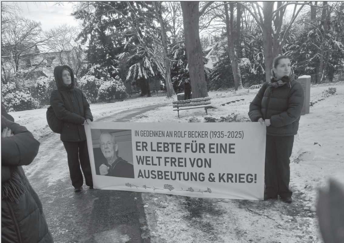
Die DIDF-Jugend Hamburg auf dem Friedhof Ohlsdorf